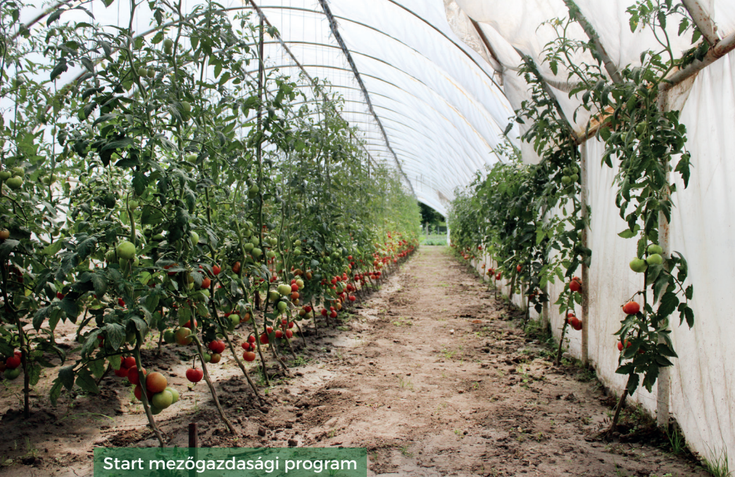
Start mezőgazdasági program