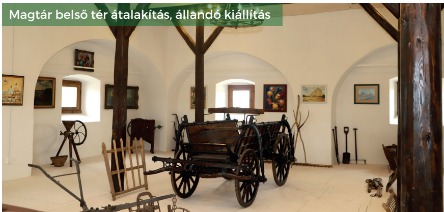
Magtár belső tér átalakítás, állandó kiállítás

Tovább folytatódnak a fejlesztések Hosszúpályiban, nem állt meg a munka a koronavírus-fertőzés hatására sem.