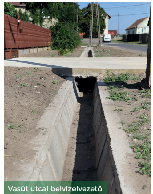
Vasút utcai belvízelvezető