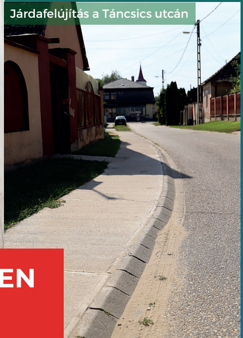
Járdafelújítás a Táncsics utcán