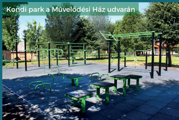
Kondi park a Művelődési Ház udvarán