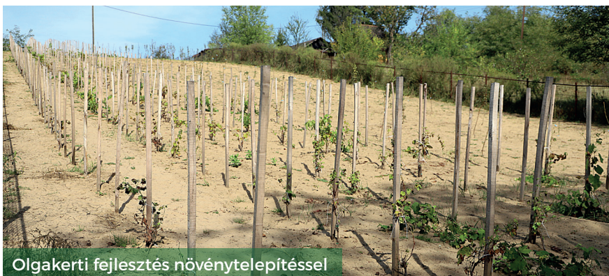
Olgakerti fejlesztés növénytelepítéssel