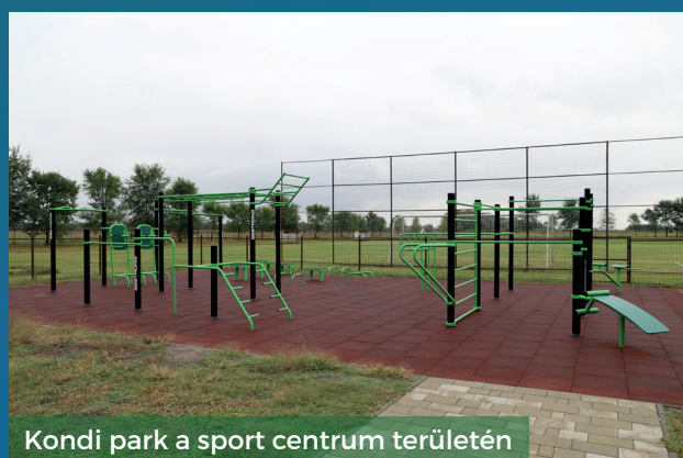
Kondi park a sport centrum területén