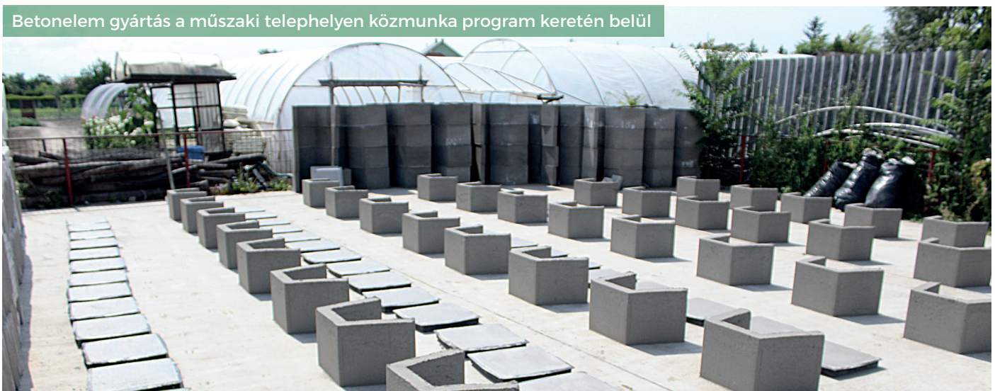
Betonelem gyártás a műszaki telephelyen közmunka program keretén belül